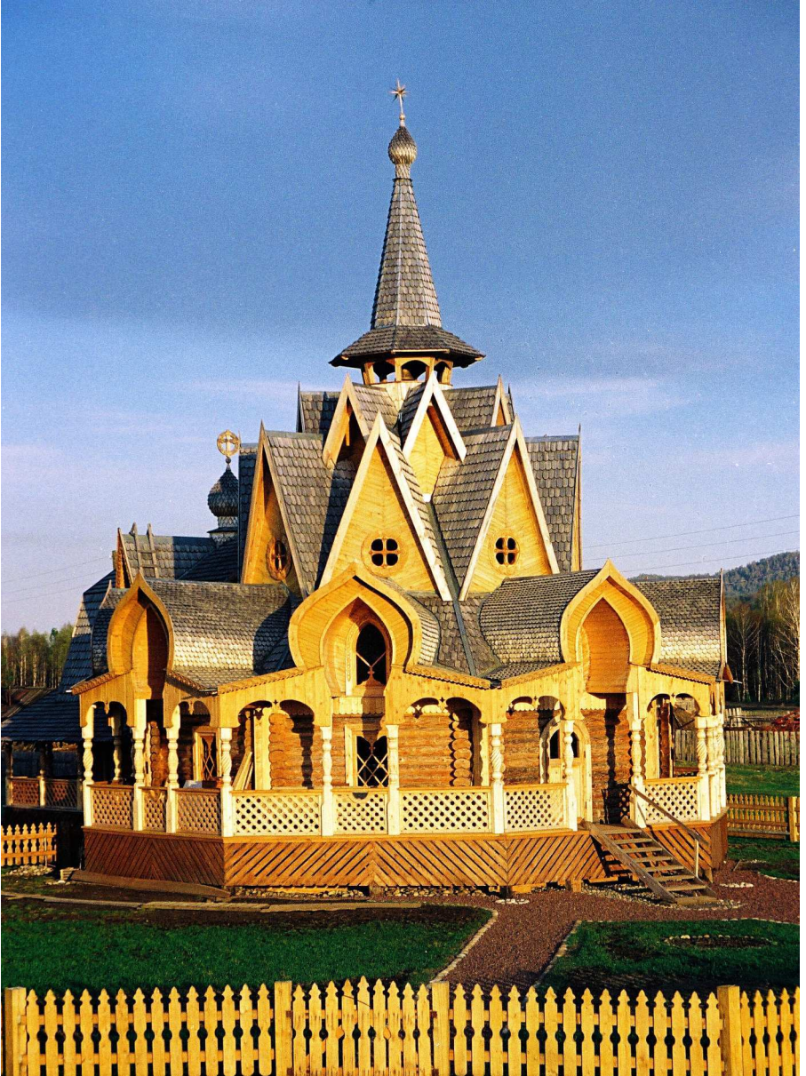
Haus des Segens in Petropáwlowka